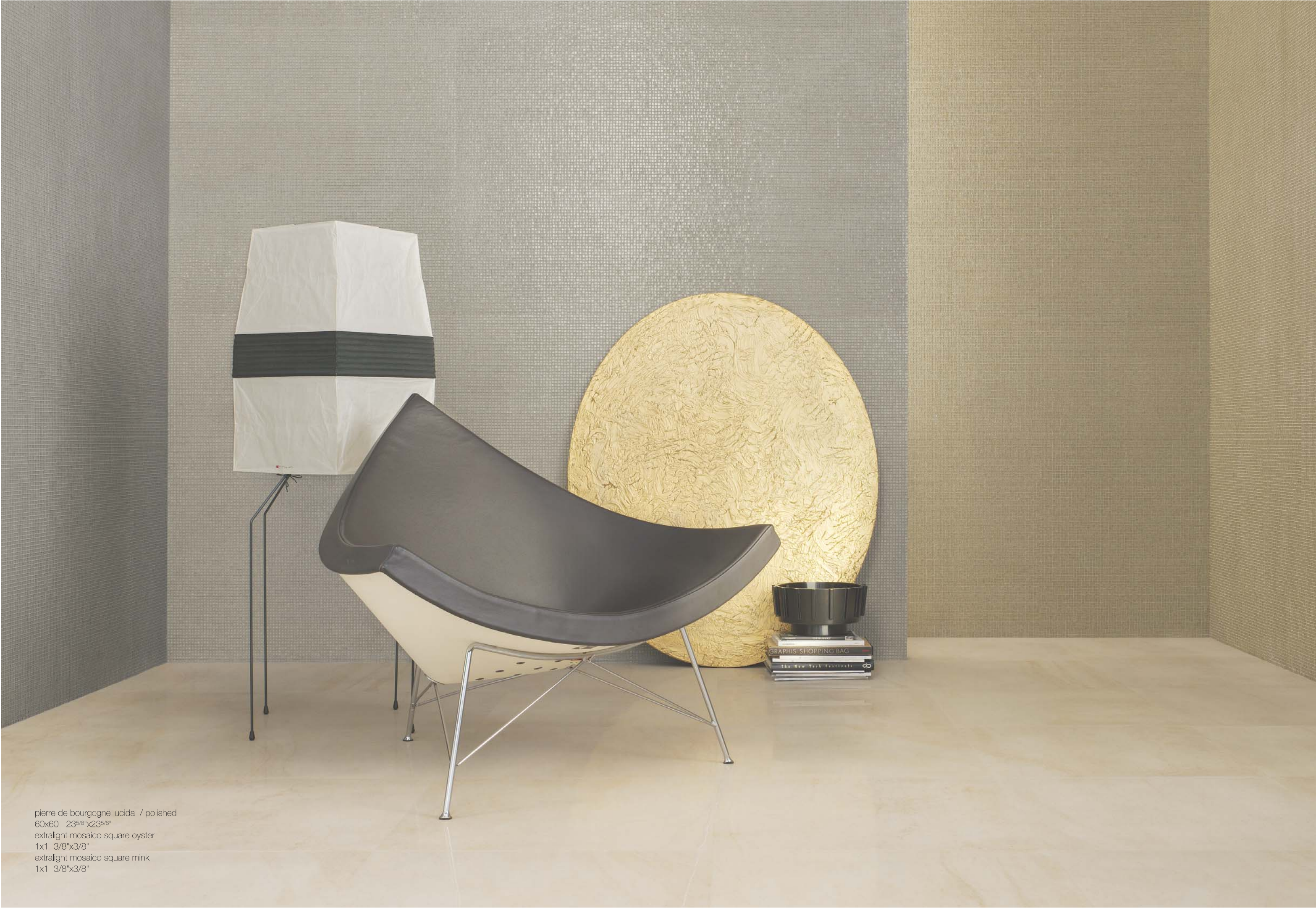
pierre de bourgogne lucida / polished 60x60 23 5/8 x23 5/8 " extralight mosaico square oyster 1x1 3/8"x3/8" extralight mosaico square mink 1x1 3/8"x3/8"