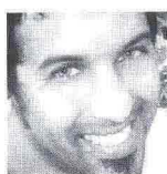
di Jonas W. Bendaou Milano - Parigi www.gruppobea.it design [Milano - Paris]

— Nel cuore della city di Londra, in un bellissimo loft, è stato realizzato un bagno che respira tutta l'aria targata "luxurystyle". Uno spazio semplice ed equilibrato che tende a valorizzare ogni elemento e rievoca una delicatezza volta tutta al femminile. La grande doccia al centro della stanza crea la giusta area dedicata ai sanitari e si affaccia sullo spazio in cui spiccano gli esclusivi lavabi di antoniolupi. La ricercatezza, che ha come elemento comune il tratto dorato, permea i singoli accessori che diventano opere prime di un bagno davvero pregiato. La cura del corpo è affidata a pochi e semplici movimenti.