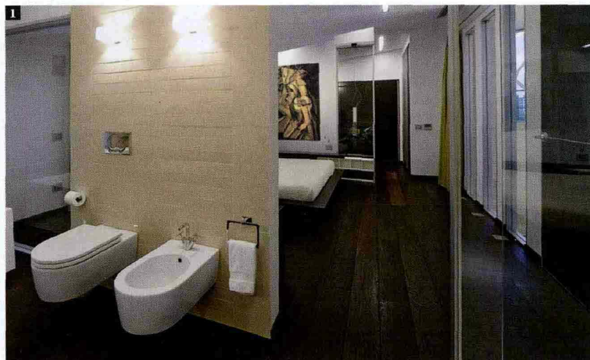
1 Bagno padronale: sanitari sospesi Ceramica Flaminia, rubinetteria Isy di Zucchetti, con finitura cromata.